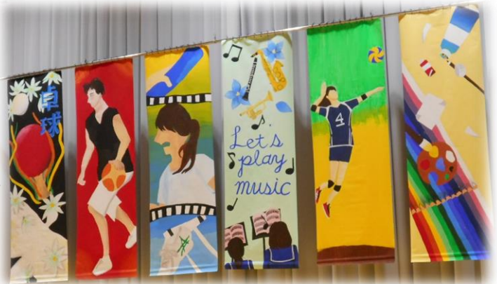
【体育館ステージに飾られた各部への応援旗：美術部作成】

6月22・23日は、北信大会でした。北信地区各所において、熱戦が繰り広げられました。本校からは、男女卓球団体(地区大会：「男子」2位「女子」3位)男子バスケ(地区大会「優勝」)、女子バスケ(地区