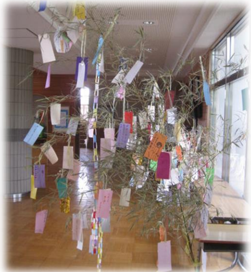
生徒玄関に飾られた七夕飾り

日本には昔から続く、様々な伝統があります。「七夕飾り」もそんな伝統の1つとして、学校生活の中でつなげて行けたらと思います。