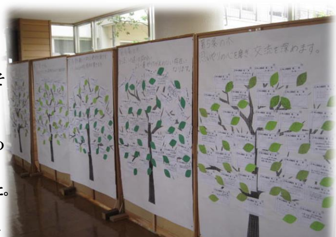
【My人権宣言が集められた「人権の木」より】

私たちはこの「My人権宣言」をスタートとして、それぞれの人権感覚を磨き・高めていきたいと思っています。