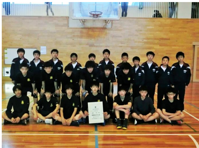
表彰式後の集合写真より